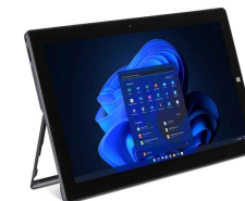
Tipcover optional erhältlich